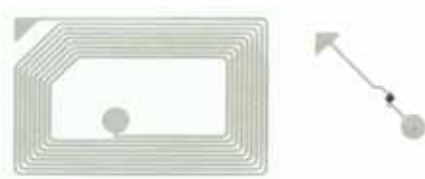
一种电子标签生产方法的专利 (天线由各向同性导电银胶印刷制成)